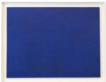
Le Monochrome IKB Bleu, « Godet », 150 x 198 cm. Collection MAMAC Nice. (Attention de retirer le CADRE pour publication).

« Je suis allé signer mon nom de l'autre côté du ciel »