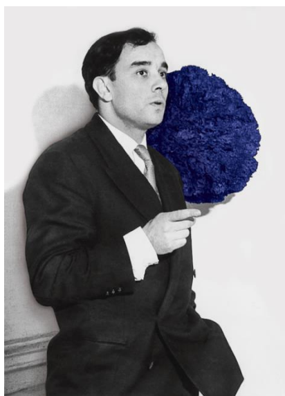
Yves Klein, Londres, 1957

LEXPO AUGMENTEE YVES KLEIN... La vibration de la couleur Du 6 juillet au 30 septembre 2018 au premier étage du Centre Nicétoile