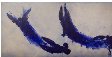
Anthropométries sans titre (ANT 84) -155 x 359 cm- 1960, Achat 1988 - Mamac Nice

« Cette symphonie est constituée d'un seul et unique « son » continu, étiré, privé de son attaque et de sa fin, ce qui crée une sensation de vertige, d'aspiration de la sensibilité hors du temps. Cette symphonie n'existe donc pas tout en étant là, sortant de la phénoménologie du temps, parce qu'elle n'est jamais née, ni morte, après existence, cependant, dans le monde de nos possibilités de perceptions conscientes ; c'est du silence - présence audible"