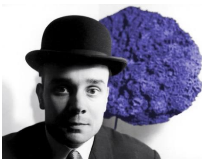
Yves Klein lors du vernissage de l'exposition "Monochrome Propositions of Yves Klein", Gallery One, Londres, 1957 Yves Klein Portrait

« L'artiste futur ne serait-il pas celui qui, à travers le silence, mais éternellement, exprimerait une immense peinture à laquelle manquerait toute notion de dimension ? »